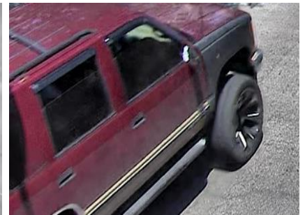
Actual photographs of the wanted vehicle

The Major Accident Investigation Unit encourages anyone who may have any information about this crash to contact this investigative unit at 312-745-4521.