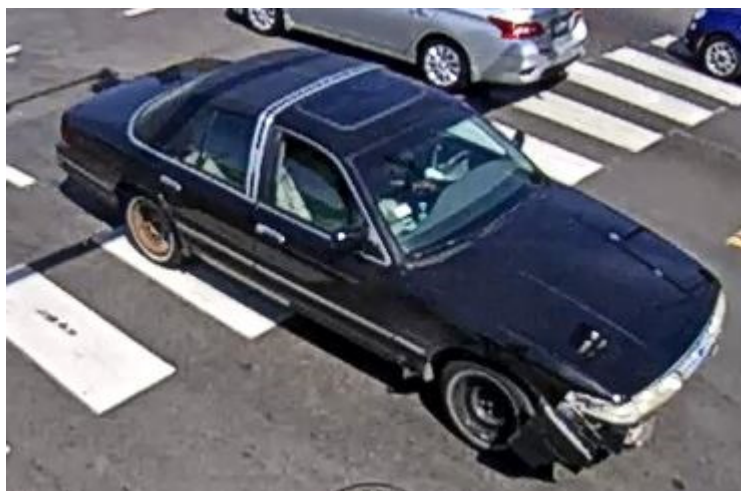
Actual photograph of the wanted vehicle

The Major Accident Investigation Unit encourages anyone who may have any information about this crash to contact the investigative unit at 312-745-4521