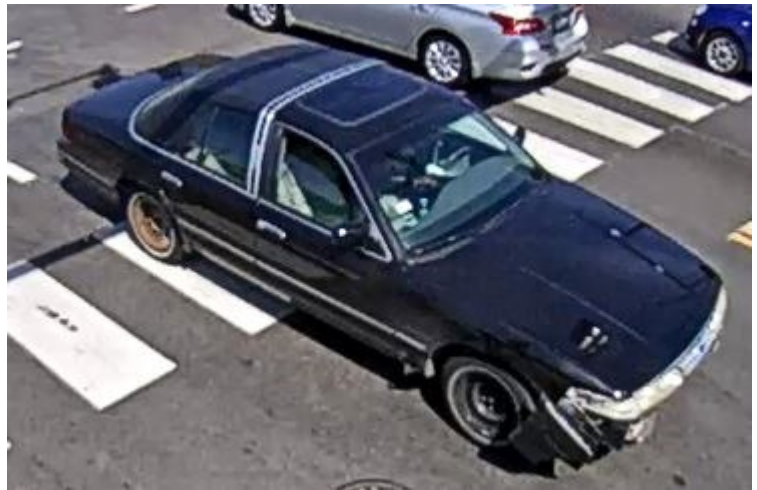
Fotografía real del vehículo buscado

La Unidad de Investigación de Accidentes Mayores pide a cualquier persona quién pueda tener información sobre este accidente que se comunique al 312-745-4521