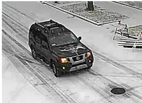
(Actual Picture of Wanted Vehicle)