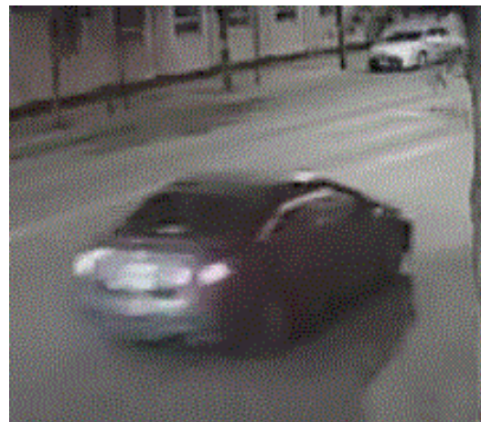
Fotografía actual del vehículo buscado

La Unidad de Investigación de accidentes mayores alienta a cualquier persona de pueda tener información sobre este accidente a ponerse en contacto con esta unidad de investigación 312-745-4521