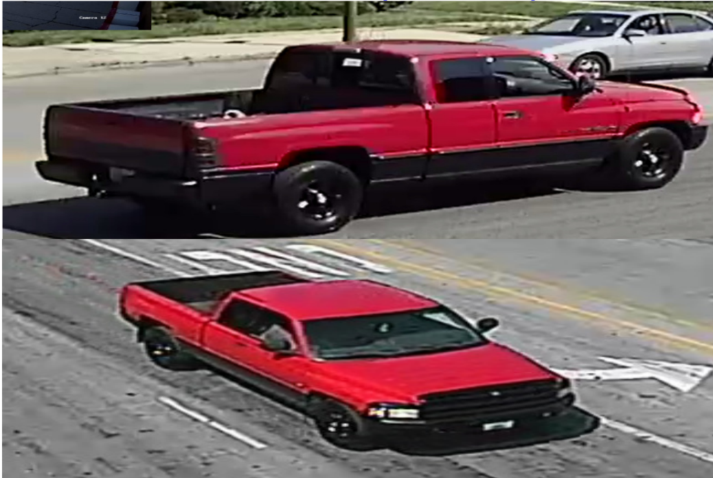
Foto real del vehículo